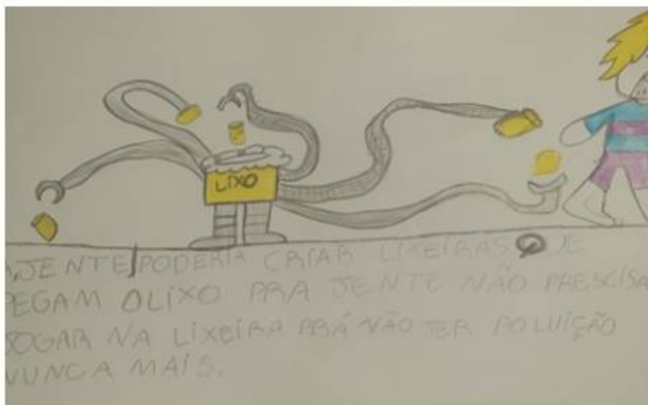
criação de uma lixeira eletrônica.